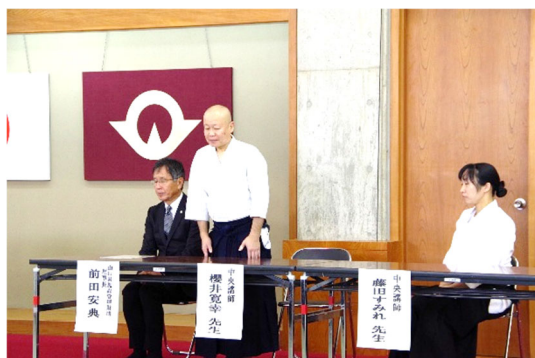
講師紹介(中央講師)