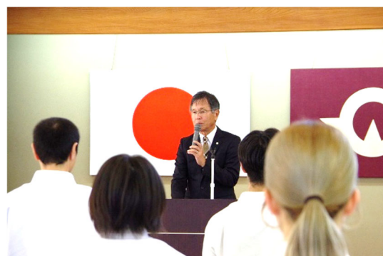
主催者挨拶(山口県施設管理財団理事長)