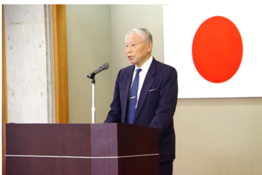
山口県合気道連盟会長挨拶