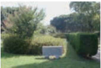
⑤献木 (1973) 全17団体・クラブ・会 社・個人が共同での献木 を記念したもの