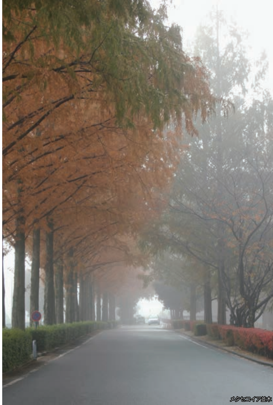
メタセコイア並木