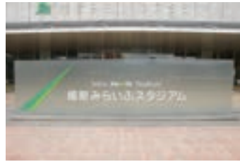
⑫維新みらいふスタジア ム (2011) 陸上競技場のネーミング ライツにより設置