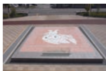
㉕ モニュメントちよるる (2011) 「2011おいでませ!山口国体・山口大会」開催を記念し萩焼陶板を組合せてちよるるを模したもの