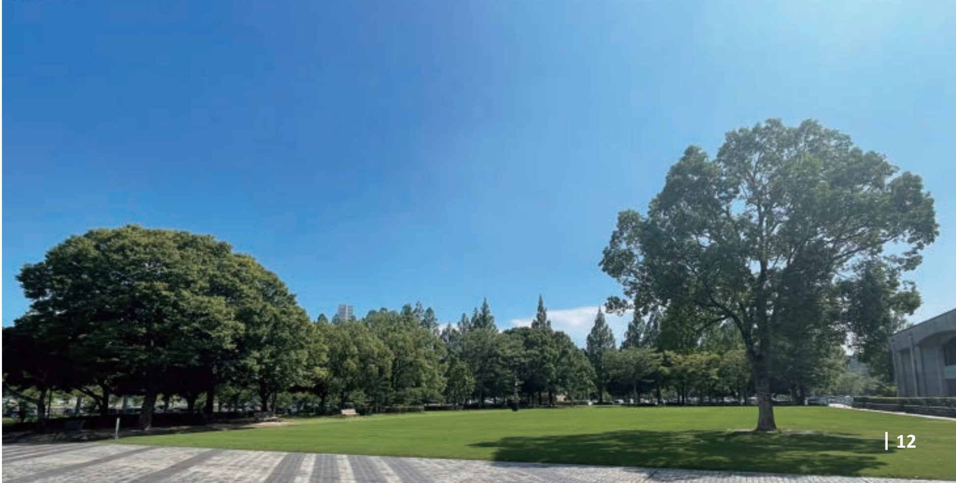
維新大晃アリーナ