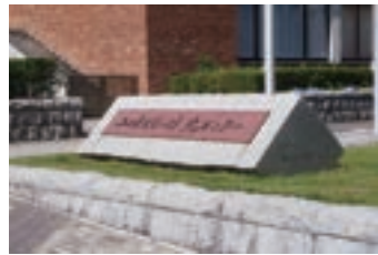
⑩山口県スポーツ文化セ ンター (1984) 平井龍山口県知事による 書