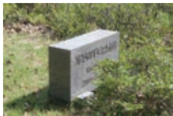
⑥創立50周年記念植樹農 林中央金庫山口支所 (1974) 農林中央金庫山口支所創 立50周年を記念し植樹