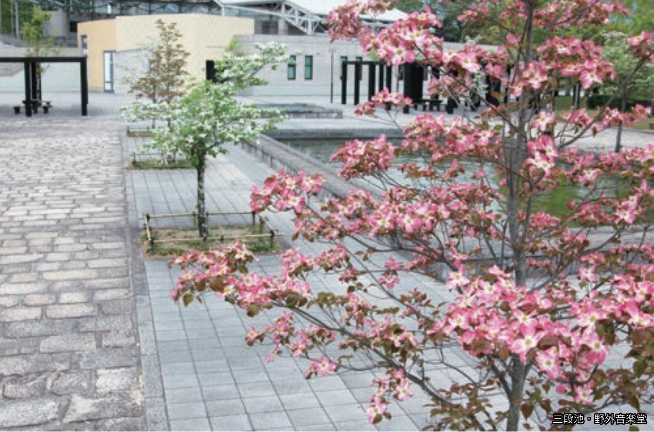
三段池・野外音楽堂