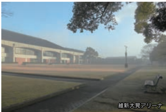
維新大晃アリーナ