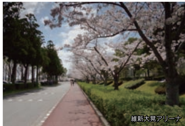
維新大晃アリーナ