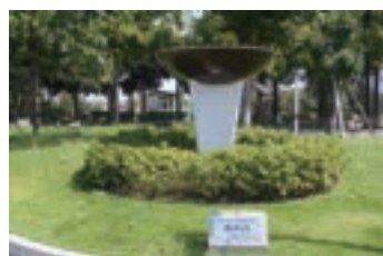
㉗ 第18回国民体育大会炬火台 (1963) 旧陸上競技場の灯火台。2011改築に伴い移設