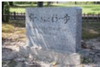
④明治維新百年記念植桜 木 (1968) 日本青年会議所山口ブ ロック協議会が明治維新 百年を記念して桜を植樹