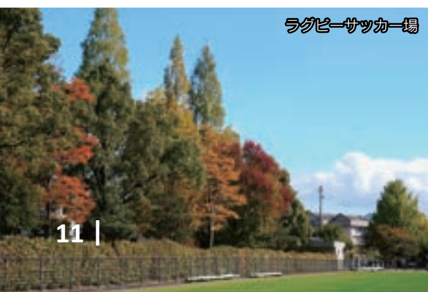
ラグビーサッカー場