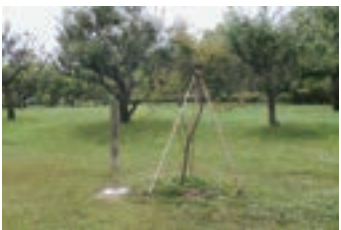
⑦山口県西京ライオンズ クラブ・京洛東ライオ ンズクラブ姉妹提携35周 年記念植樹 (2012) 両ライオンズクラブ姉妹 提携35周年を記念し植樹