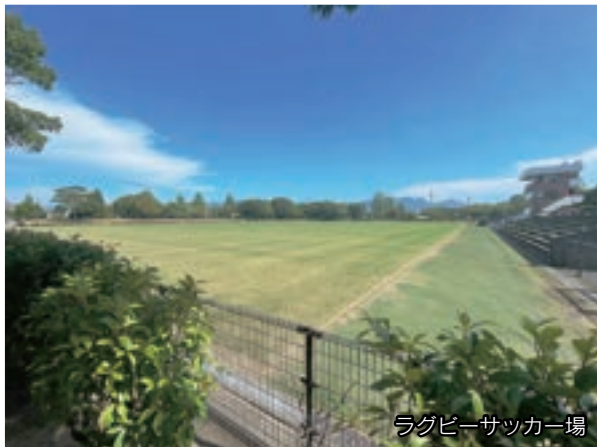
ラグビーサッカー場