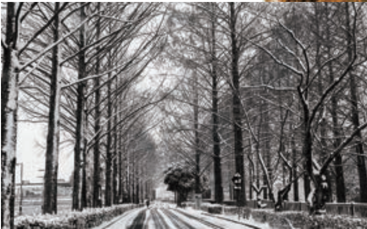
維新百年記念公園 百景