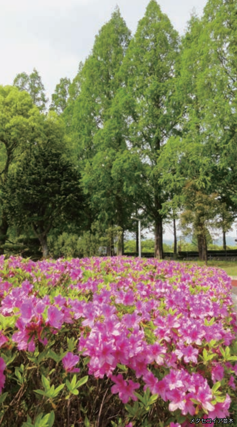
メタセコイア並木