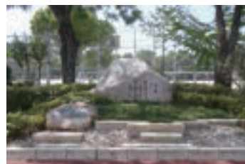
㉑ 御製碑 (2012) 「2011おいでませ!山口国体・山口大会」開催を記念し、天皇陛下が詠まれた御製