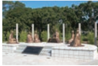
⑭孔子杏壇講学像 孔子とその弟子たちの像 (2007) 山口県と山東省友好協定 締結25周年を記念して山 東省より寄贈