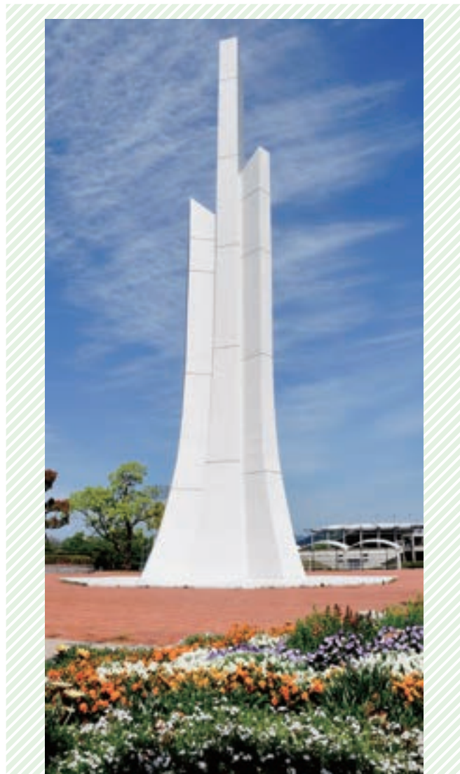
㉖ 記念塔 (1973) 開園の年に建立。真・善・美の三本柱を山口の「山」の文字に模して天に向かって限りなく前進することを表現