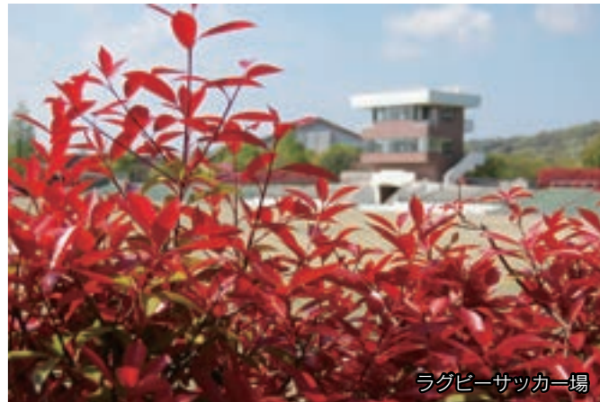
ラグビーサッカー場