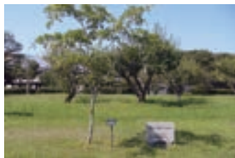
⑧山口県親木会創業30周 年記念植樹 (2003) 山口県親木会創業30周 年を記念しヒトツバタゴ を植樹