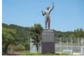
⑯栄光 (1963) 第18回国体開催を記念す る奉仕活動事業で建立