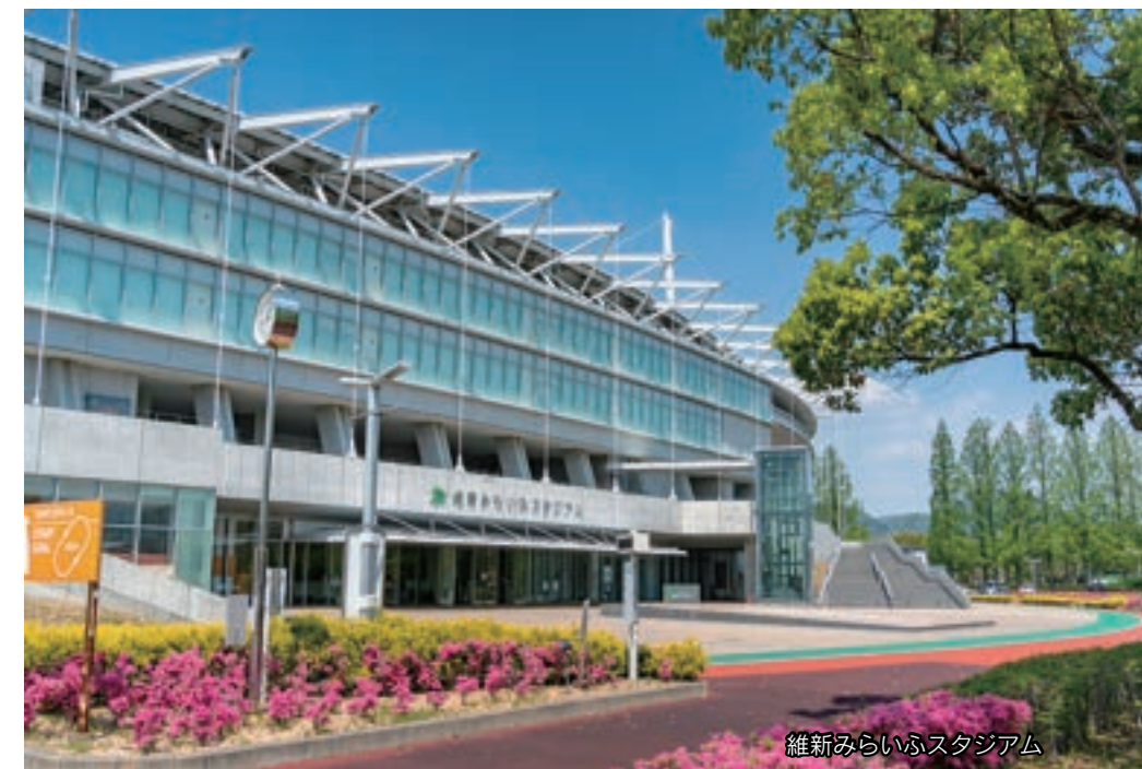
維新みらいふスタジアム