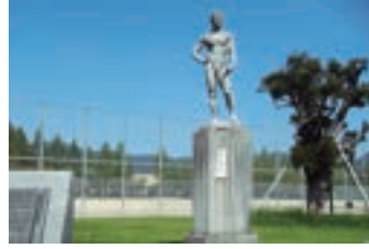
⑮競技者 (1963) 友愛青年同志会山口支部 より贈呈