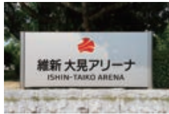
⑪維新大晃アリーナ (2019) スポーツ文化センターの ネーミングライツにより 設置