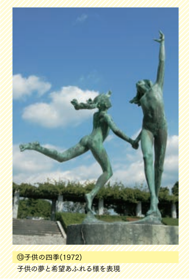
⑬子供の四季(1972) 子供の夢と希望あふれる様を表現