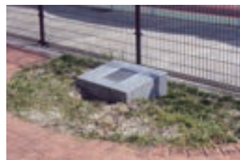
㉒ 日本の都市公園100選 (1989) 日本の都市公園100選に選ばれたことを記念した碑