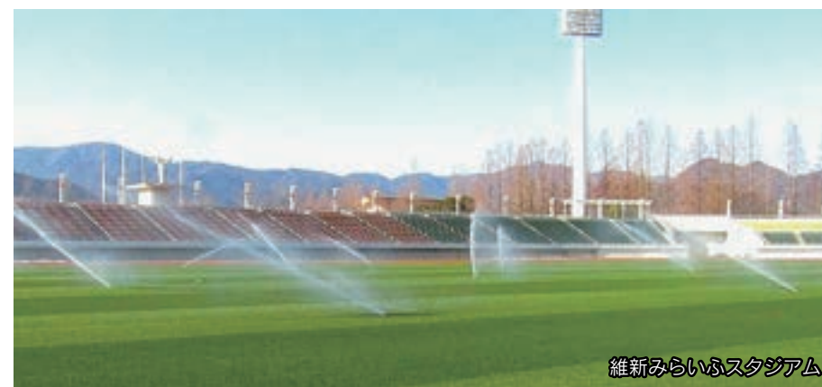
維新みらいふスタジアム