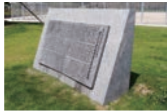
⑳ 第18回国民体育大会開催記念山口県陸上競技場建設寄付者芳名碑 (1963) 旧陸上競技場建設寄付者芳名