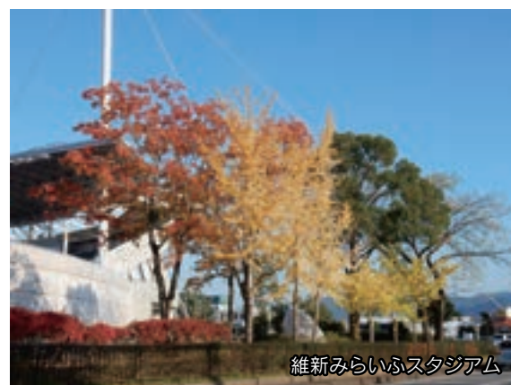
維新みらいふスタジアム