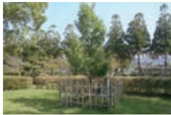
①オークの木 (2002) 日英同盟締結100周年を 記念して植樹