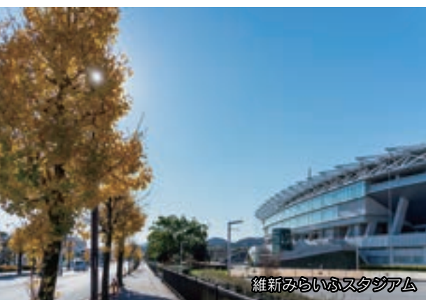
維新みらいふスタジアム