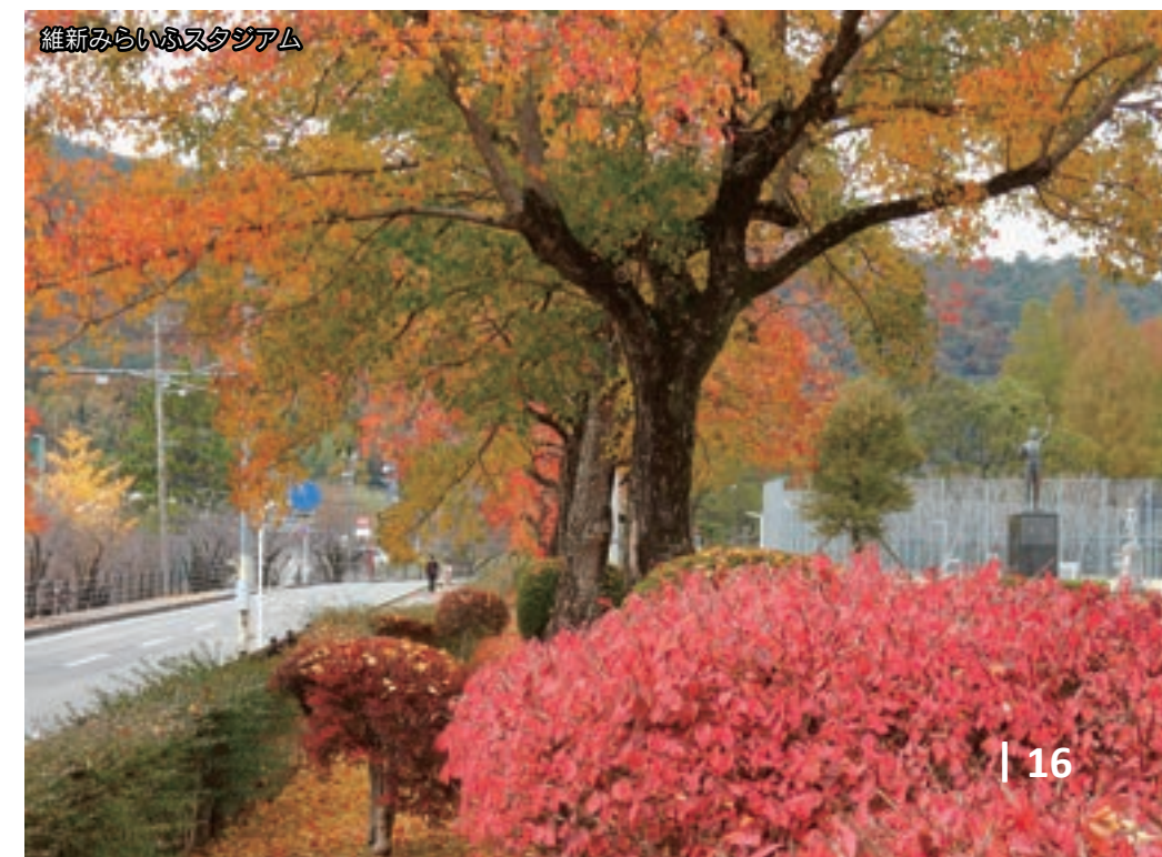
維新みらいふスタジアム