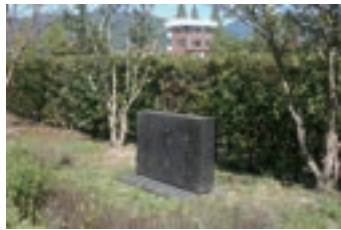
③滝口純氏の功績をたた えての記念樹 (1977) 県ラグビーフットボール 協会育ての親 滝口氏を たたえて植樹