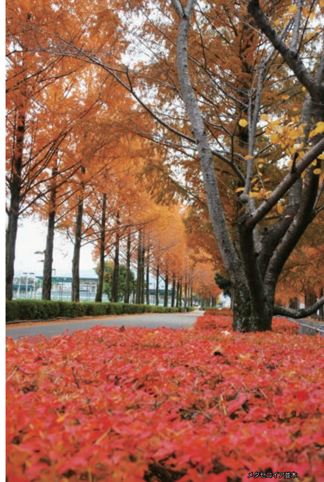
メタセコイア並木