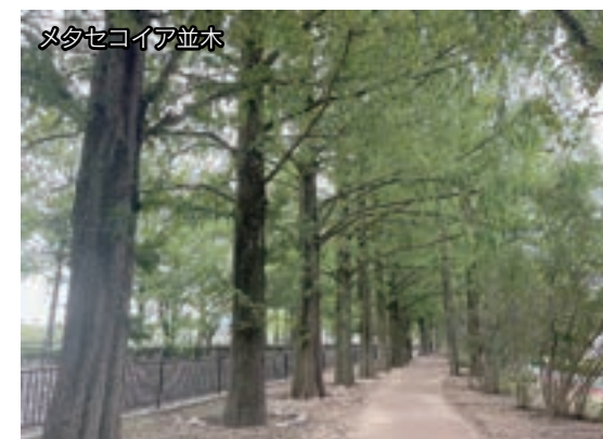
メタセコイア並木