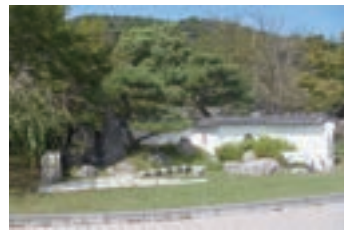
⑱ スポットガーデン (1991) 山口県の観光名所である、秋芳洞、萩城下町、錦帯橋を配し「美しい自然と歴史のロマン溢れる山口」を表現