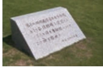
⑱第18回国民体育大会会 場建設の陸上自衛隊整地 の碑 (1962) 第18回国体会場として陸 上競技場建設時に陸上自 衛隊が整地