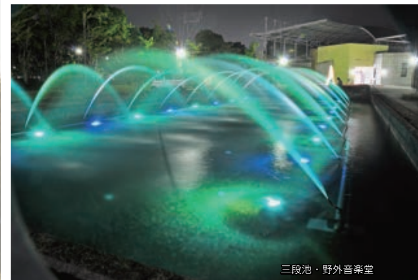
三段池・野外音楽堂