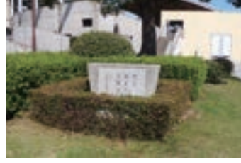
⑰花と緑と太陽と (1973) 昭和48年11月22日開園に あたり、橋本正之山口県 知事による書の記念碑設 置