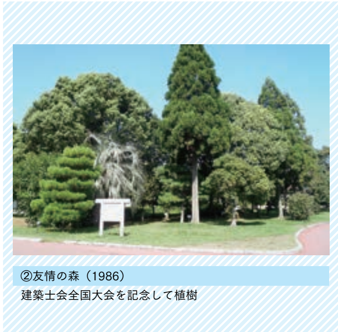
②友情の森 (1986) 建築士会全国大会を記念して植樹