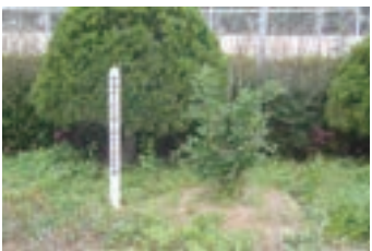
⑨田島記念陸上競技大会 記念樹 (2004) 田島記念陸上大会開催を 記念し植樹