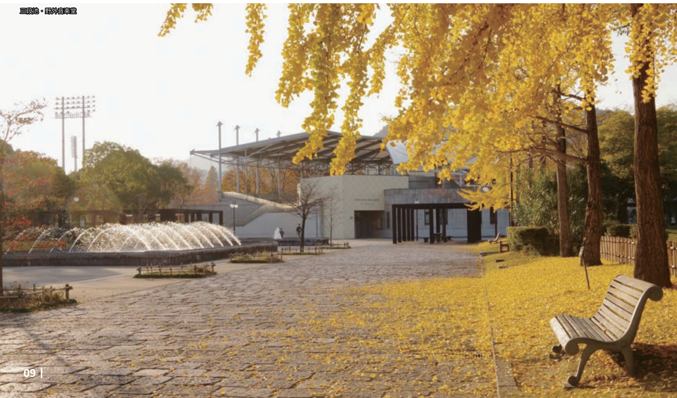
三段池・野外音楽堂