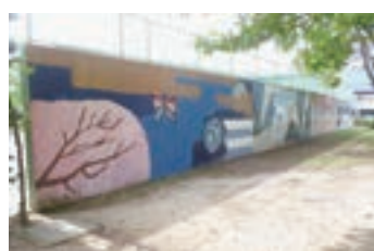
㉘ テニス壁打ち壁画 (1993) 山口市立鴻南中学校美術部が描いたもの。NHK「にっぽん縦断こころ旅」で紹介された。