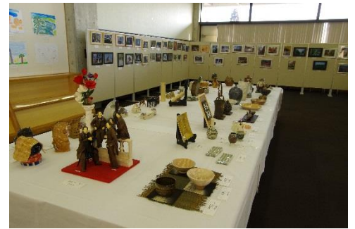
昨年度の芸術フェスタ

維新公園の四季折々の風景やスポーツ、イベントの写真や絵画のほか、陶芸・書道・手芸などの作品を募集しています！